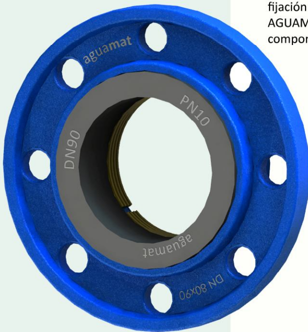
PERFORADO DE LA BRIDA SEGÚN NORMA ISO7005/2

Fabricado en hierro dúctil, con anillo interno de goma que asegura el perfecto sellado. Cuenta también con un aro de bronce que permite una fijación óptima sobre tubos de PEAD, haciendo del adaptador AGUAMAT de gran utilidad para unir este tipo de tubos a otros componentes con brida.